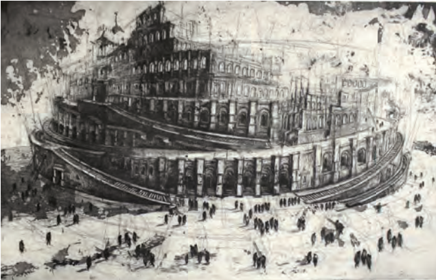
GUSTAVO DIAZ SOSA | Babylon XXI | Radierung