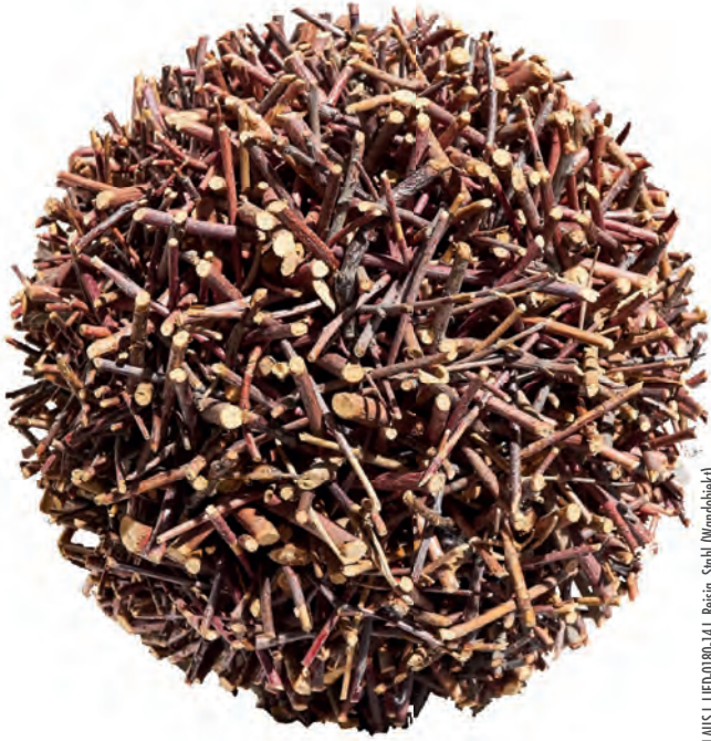
NOBERT KLAUS | LIEB-080-14 | Reisig, Stahl (Wandobjekt)