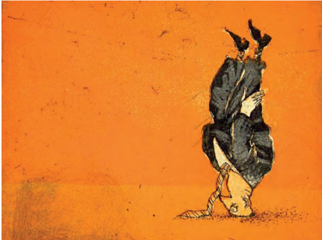
GÜNTHER RÜCKERT | Sei ein Grashalm und wachse | Radierung (Ausschnitt)