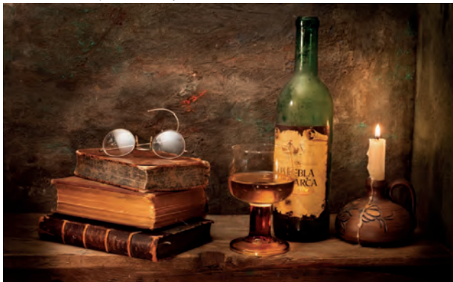
MOS SAMII | [Stilleben] | Fotografie (Ausschnitt)