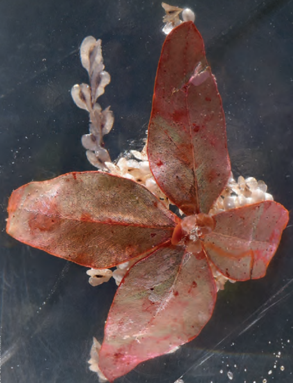
KE U | Leben aus dem Nichts

AUSSTELLUNG 1.9.-13.10. GALERIE ARTLET-STUDIO HARSEWINKELGASSE 21 [EHEMALS ARTLET-DEPOT] AM 1.9.2018 ERÖFFNUNG 16:00 - 24:00 UHR.