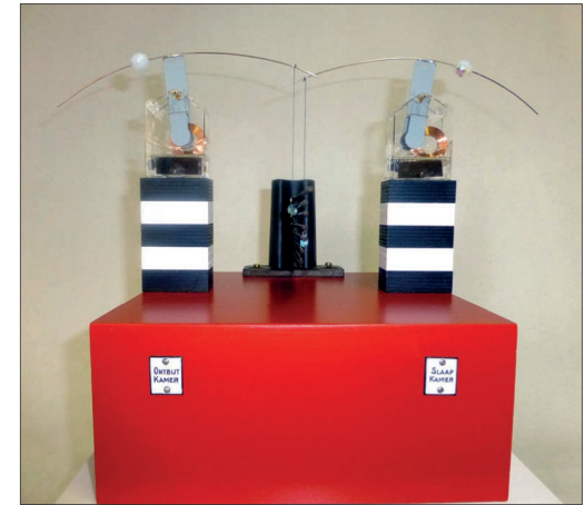
Room service solar