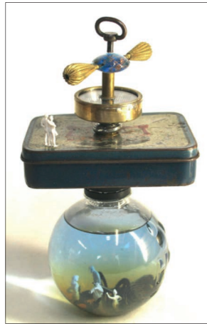
Auberge de vie